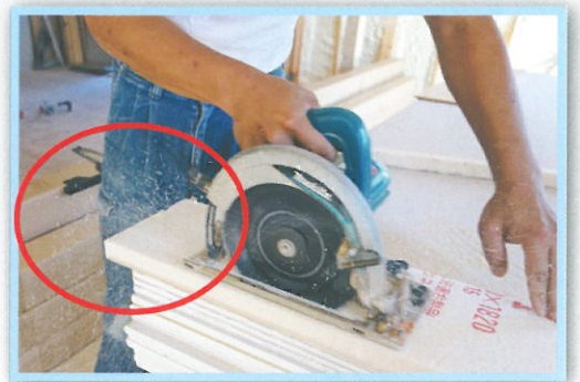
木マルノコ使用時