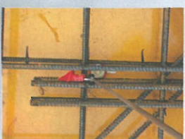
スラブ配筋の鉄筋のあき 25mmを確認。