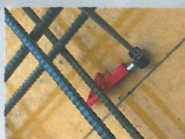
スラブ配筋のかぶり厚さ 30mmを確認。