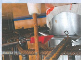
梁貫通補強の最低かぶり厚さ 40mmを確認。