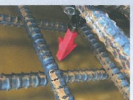
配筋かぶり厚さの見えにくい場合でも確認できる。