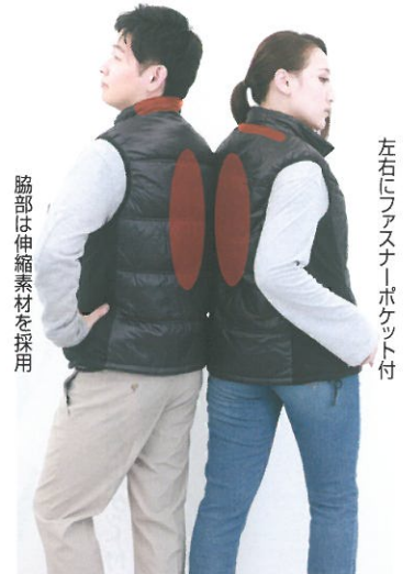
首から背中までヒーター内蔵