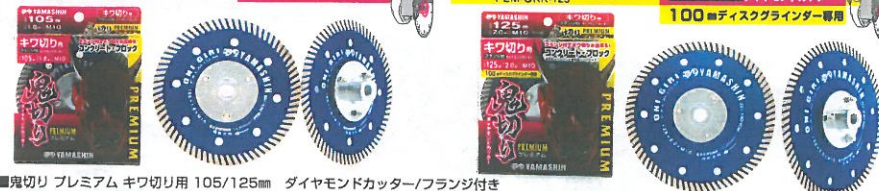
■鬼切り プレミアム キワ切り用 105/125mm ダイヤモンドカッター/フランジ付き

キワ切り用 フランジ付 ダイヤモンドカッター 100mmディスクグラインダー専用