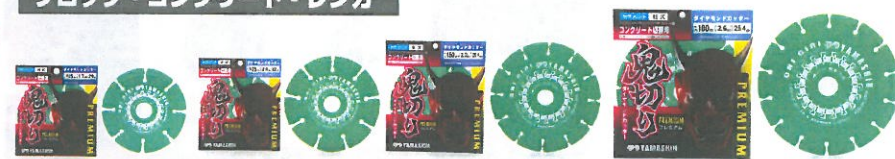
■鬼切り プレミアム コンクリート切断用 ダイヤモンドカッター/セグメント/乾式/鉄筋入りコンクリート(鉄筋10mmまで)