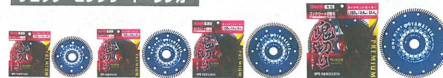
■鬼切り プレミアム コンクリート切断用 ダイヤモンドカッター/ウェーブ/乾式/鉄筋入りコンクリート(鉄筋10mmまで)