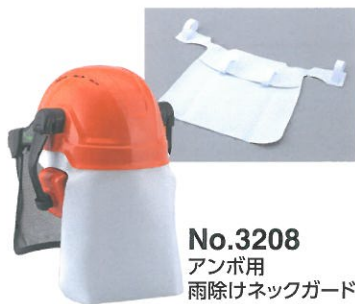
No.3208 アンボ用 雨除けネックガード No.3220F専用 ¥920 110842 製品重量:約50g