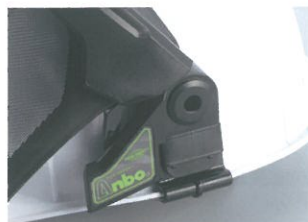
No.T-3011 ¥440 101208 TOYO No.150, No.170, No.300, No. 310, No.370F, No.380Fのように周囲に幅 の広いミゾのあるヘルメットに使用します。

※ご利用になられるヘルメットに合った取付部品 を選択して取付けてください。 (一部取付けできない形状のヘルメットがあります。)