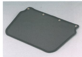
No.3017 取替えメッシュ ¥1,400 102526 ステンレス製 24メッシュ 長さ 200mm 製品重量:約91g