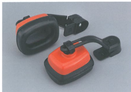
No.3205 ¥4,200 111696 イヤーマップル 製品重量:約199g