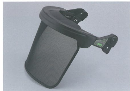
No.3207 ¥4,800 111702 ステンレス製 メッシュシールド 製品重量:約239g