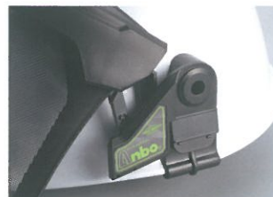
No.S-3012 ¥440 101215 TOYO No.110, No.140, No.360のように 周囲にミゾのないヘルメットに使用します。