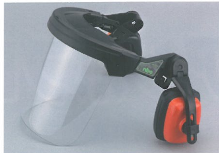
No.3202 ¥9,200 111665 PET製透明シールド+イヤーマップル 製品重量:約428g