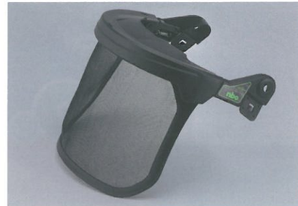
No.3203 ¥4,200 111672 ナイロン製 メッシュシールド 製品重量:約191g