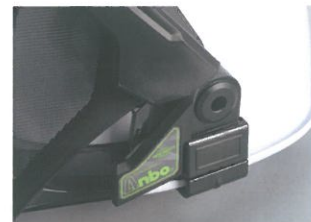
No.OK-3013 PAT ¥600 106159 TOYO No.217, No.390F, No.391, No.392F, No.393F, 395Fのように周囲 に幅の狭いミゾのあるヘルメットに使用し ます。他社のヘルメットにも取付可能です。