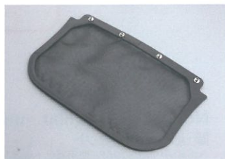
No.SP-1161 取替えメッシュ ¥1,000 110842 ナイロン製 24メッシュ 最長部長さ 195mm 製品重量:約175g