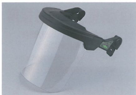
No.3204 ¥5,000 111689 PET製透明シールド 製品重量:約251g