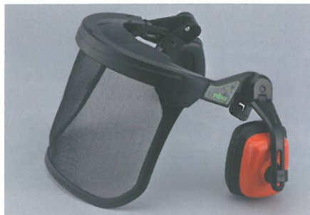
No.3201 ¥8,400 111658 ナイロン製 メッシュシールド+イヤーマップル 製品重量:約368g

■作業用ヘルメットにも取付け可能です。(3種類の取付部品を標準装備してあらゆるヘルメットに対応)