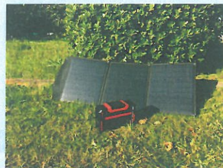
最大 90W 出力なので BA-450 の 充電に大変便利です。

品番：BA-SP90W 本体サイズ：収納時 縦415×横520×厚み20mm 使用時 縦1450×横520×厚み6.5mm 製品重量：3800g 出力：90W DC18~21.6V 5A パネル方式：モノクリスタルライン 電源コード：MC4コネクター付き3mケーブル