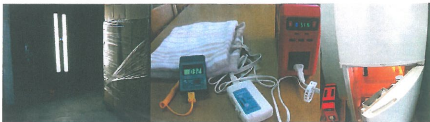
アウトドアや作業場で！ 非常時や緊急時にも大活躍！

品番：BA-450 本体サイズ：幅94×高さ196×奥行296mm 製品重量：4600g 内蔵バッテリー：三元系リチウムポリマーバッテリー 120,000mAh 3.7V 444Wh (最大) 入力：DC9V~25V MAX 4A 専用AC充電器：出力 DC15V/6A 車からの充電 DC12V MAX4Aまで ソーラーパネル充電：13V~25V MAX4Aまで (別売品) 充電時間：約10時間 出力：コンセント AC100V 60Hz×2個 (2芯+3芯タイプ) [合計450W 瞬間最大500Wまで] 出力波形：純正弦波 USBポート USB-C：40W (5V/9V/12V/15V/20V/MAX2A) ×1個 USB-C：15.5W (5V/MAX3.1A) ×1個 USB：5V/3.1A 3個 DCジャック 5.5mmPIN DC9V~12.6V×3個 シガーソケット DC9V~12.6V×1個 合計10A (MAX15A) バッテリー寿命：約500回