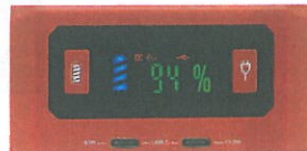
バッテリー残量が見やすい デジタル表示パネル搭載

品番：BA-450 本体サイズ：幅94×高さ196×奥行296mm 製品重量：4600g 内蔵バッテリー：三元系リチウムポリマーバッテリー 120,000mAh 3.7V 444Wh (最大) 入力：DC9V~25V MAX 4A 専用AC充電器：出力 DC15V/6A 車からの充電 DC12V MAX4Aまで ソーラーパネル充電：13V~25V MAX4Aまで (別売品) 充電時間：約10時間 出力：コンセント AC100V 60Hz×2個 (2芯+3芯タイプ) [合計450W 瞬間最大500Wまで] 出力波形：純正弦波 USBポート USB-C：40W (5V/9V/12V/15V/20V/MAX2A) ×1個 USB-C：15.5W (5V/MAX3.1A) ×1個 USB：5V/3.1A 3個 DCジャック 5.5mmPIN DC9V~12.6V×3個 シガーソケット DC9V~12.6V×1個 合計10A (MAX15A) バッテリー寿命：約500回