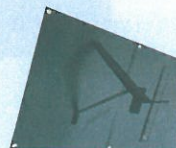
スタンド付で設置しやすい