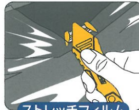
ストレッチフィルム