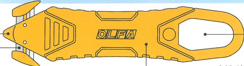
高硬度ステンレス刃で、スムーズな切れ味