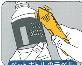
ペットボトルのラベル