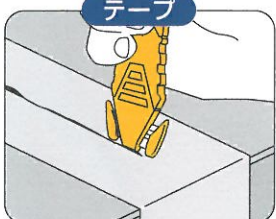
テープ 本体先端は便利な テープスリッター