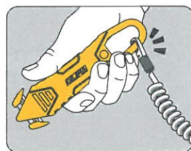
コードを取り付けること によって、本体の落下や荷物への 混入リスクを軽減できます