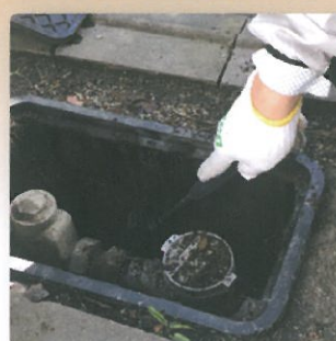
■ボックス内部の掘削に