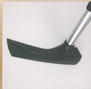
■土をすくい易い専用形状