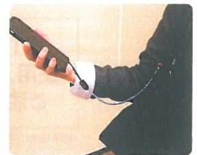
携帯電話のストラップとして