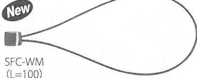
New SFC-WM (L=100)