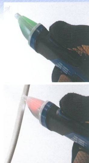
電源ONで緑色、 電圧検出で赤色に点灯