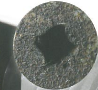
錆びてなめたネジ