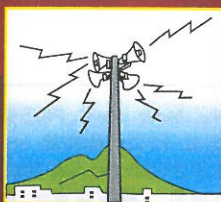
同報系防災行政無線