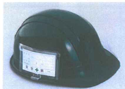
No.ID-2OK ヘルメットへの取付部