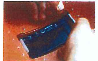
取付スプリング装着時 (P-2 内側)