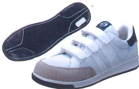
BR-04 ベルクロタイプ：ホワイト&ネイビー