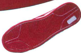
BR-03 ヒモタイプ：レッド

つま先に鋼鉄の先芯が入った、現場作業や、宅配、倉庫業などで活躍する安全シューズをスタイリッシュなスニーカータイプにしました。 ヒモタイプ、マジックタイプの2種類をご用意。 カラーも各2色からお選び頂けます