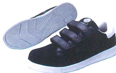
BR-04 ベルクロタイプ：ブラック