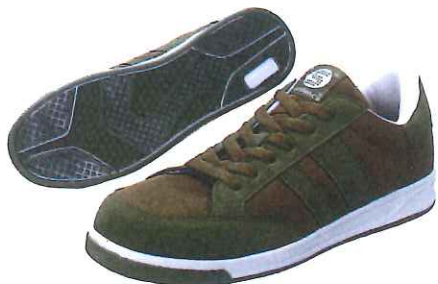
BR-03 ヒモタイプ：オリーブ

つま先に鋼鉄の先芯が入った、現場作業や、宅配、倉庫業などで活躍する安全シューズをスタイリッシュなスニーカータイプにしました。 ヒモタイプ、マジックタイプの2種類をご用意。 カラーも各2色からお選び頂けます