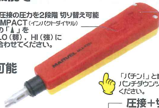
RELEASE BLADE (刃収納と解除)

圧接の圧力を2段階 切り替え可能 IMPACT (インパクトダイヤル) の「▲」を LO (弱)・HI (強)に 合わせてください。