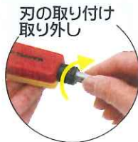
刃の取り付け 取り外し