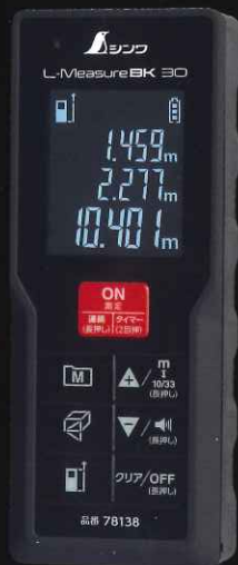
BK 30 黒