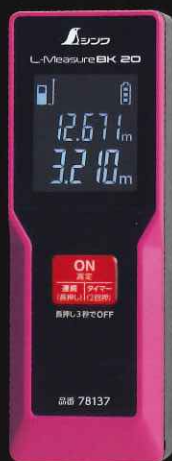
BK 20 紫