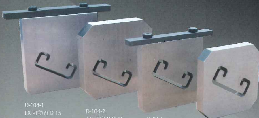
D-104-1 EX 可動刃 D-15