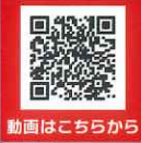
動画はこちらから