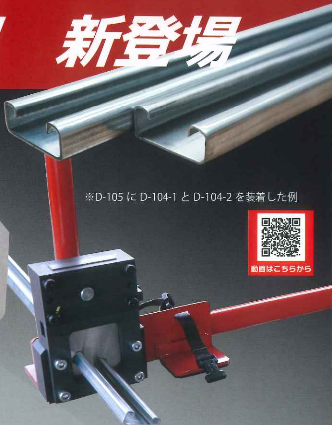
※D-105 に D-104-1 と D-104-2 を装着した例