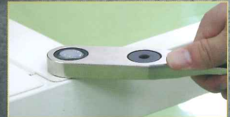
通常のギアレレンチとしても!