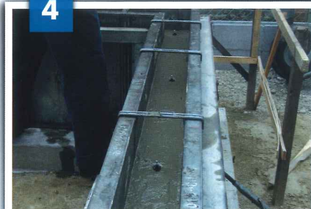
レベルビスをポイントに配置する