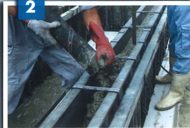
生コン打設、バイブレーター