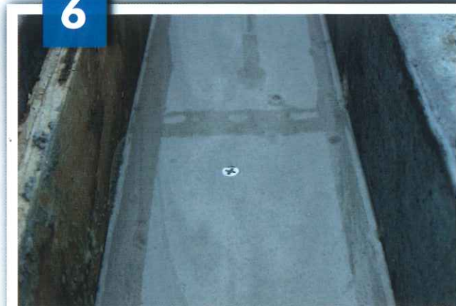
ビス頭を目安に天端レベリングを流して、 仕上げる。