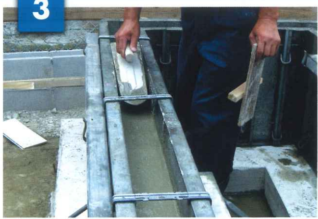
天端をコテにより均す