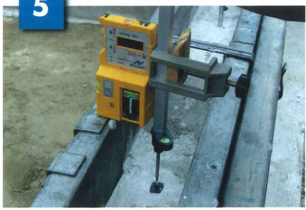
水平器付ドライバーとレーザーにより ビスの高さを調節する。