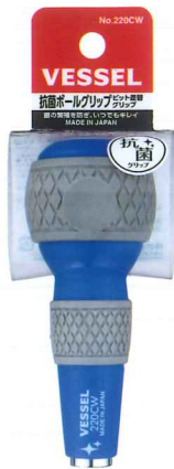
●抗菌ボールグリップ ビット差替グリップ (No.220CW)