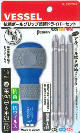
●抗菌ボールグリップ 差替ドライバーセット (No.220CW-3)