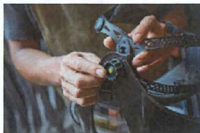
「C: 眼と面体距離の調整」のスイッチ