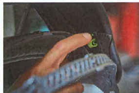
「E: ヘルメット角度の調整」のピン