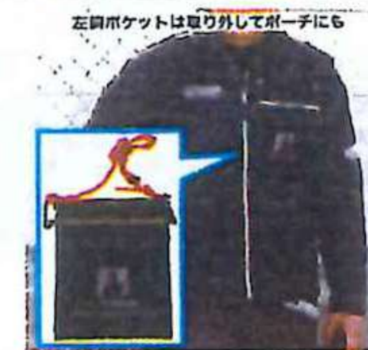
左胸ポケットは取り外してポーチに