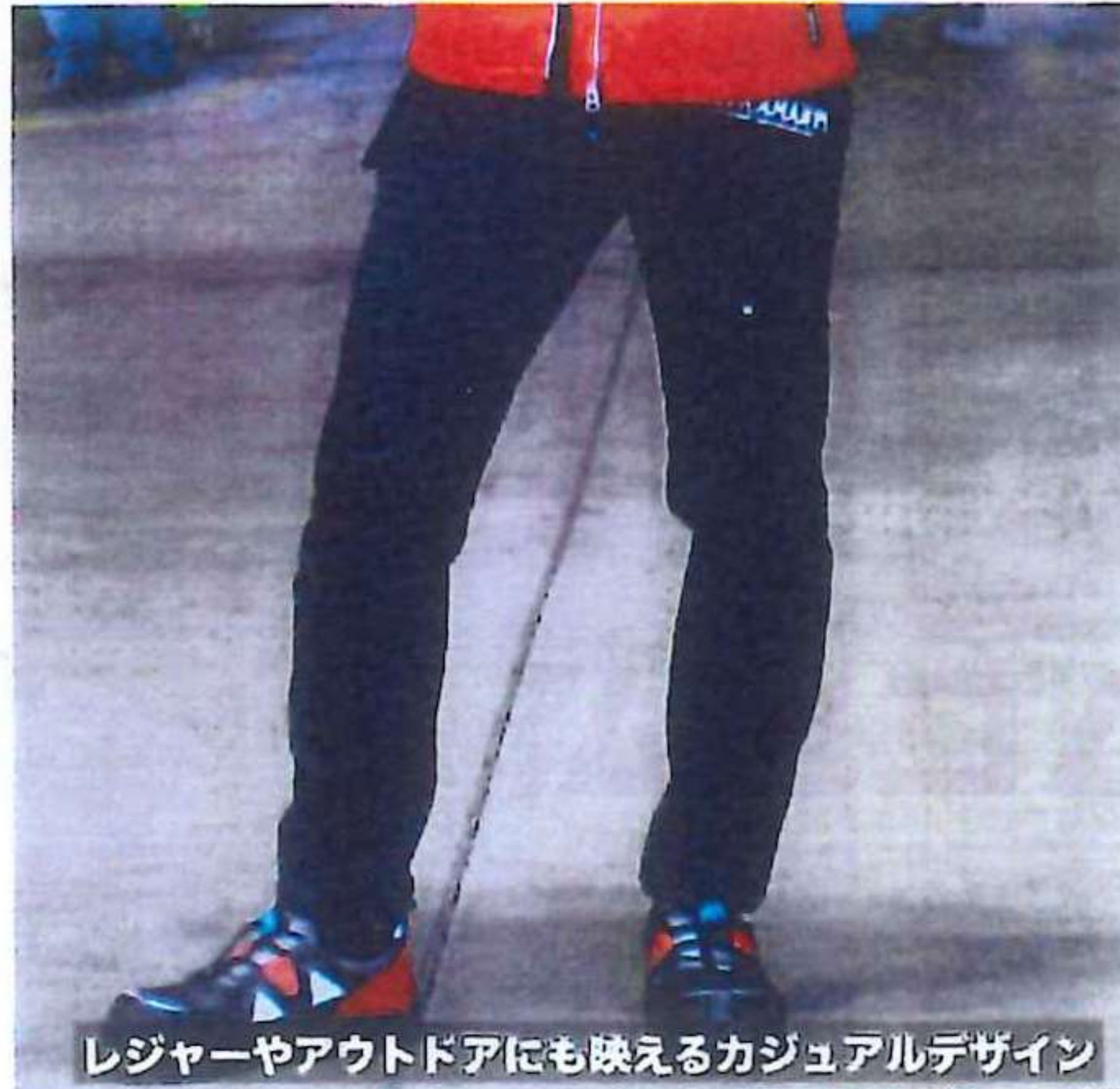
レジャーやアウトドアにも映えるカジュアルデザイン