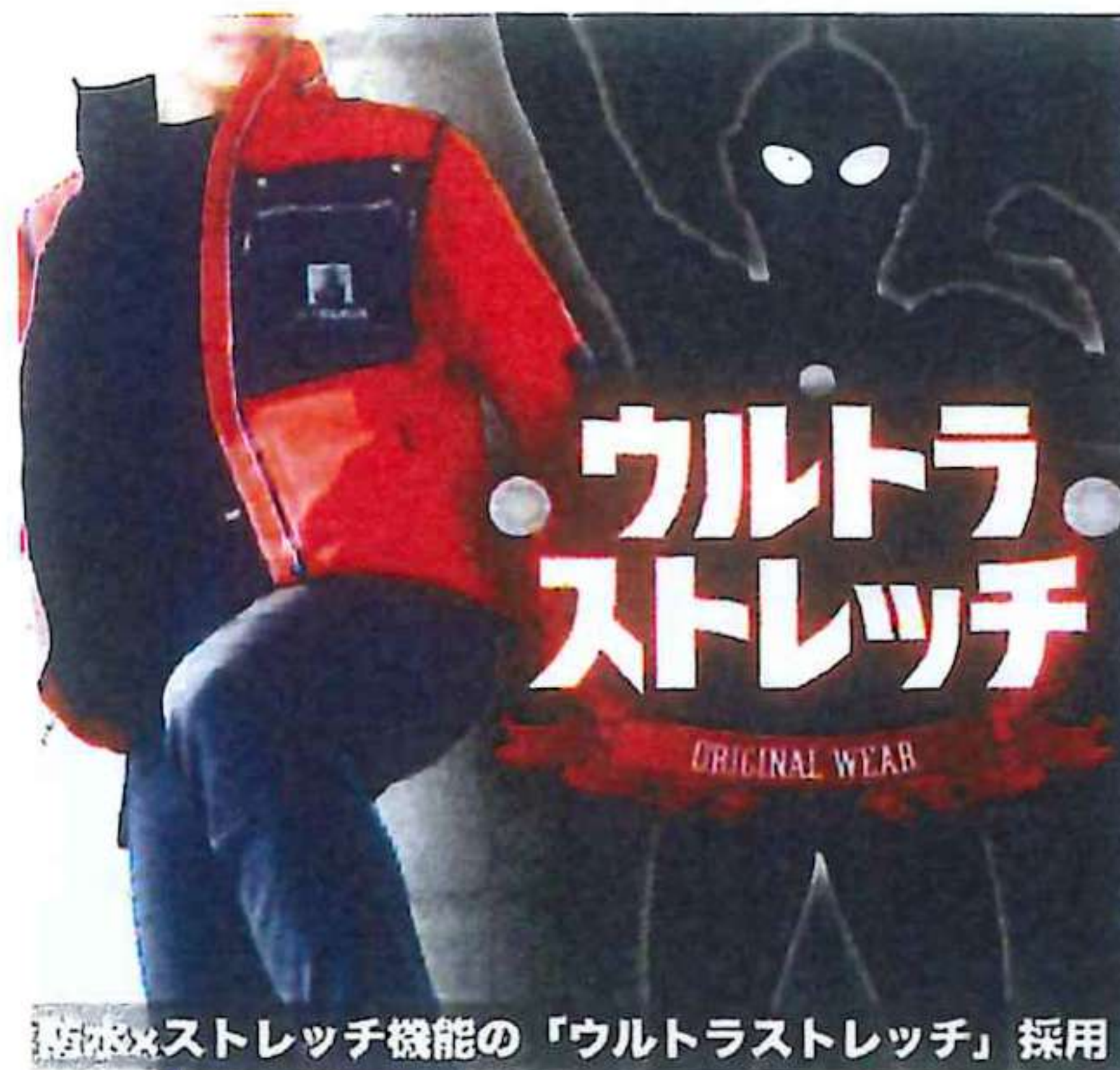
防水×ストレッチ機能の「ウルトラストレッチ」採用