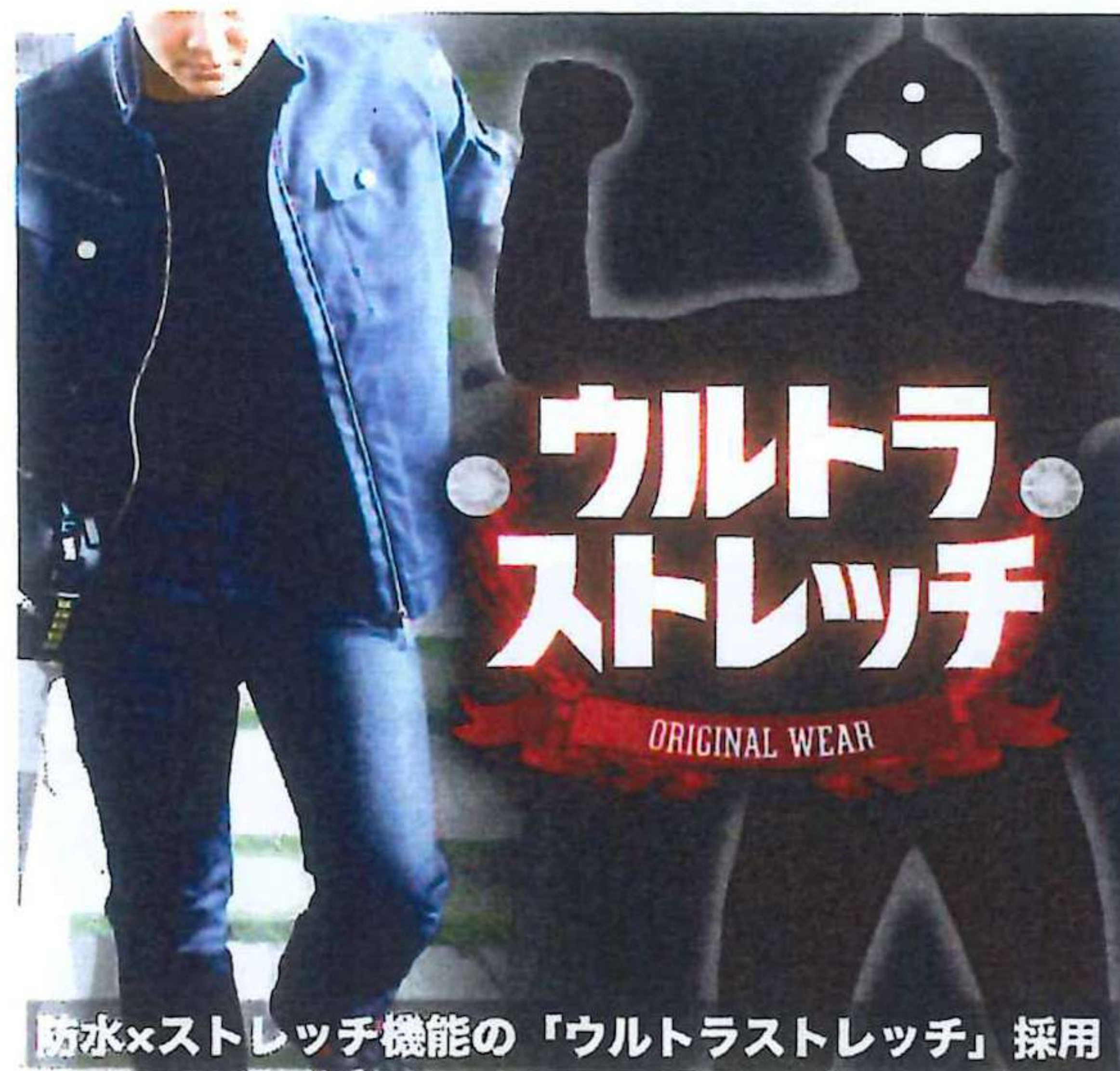
防水×ストレッチ機能の「ウルトラストレッチ」採用