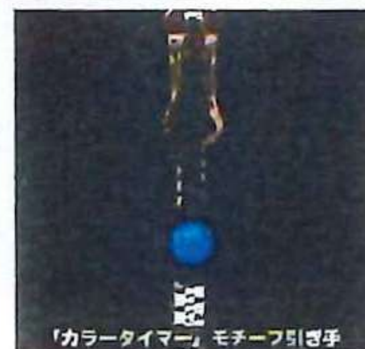
「カラータイマー」モチーフ引き手

縫い目部分より水が浸入する恐れがありますのでご注意ください。取り外しポケットは撥水加工となります。