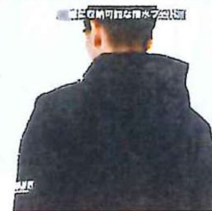
左右両側可能な撥水フード