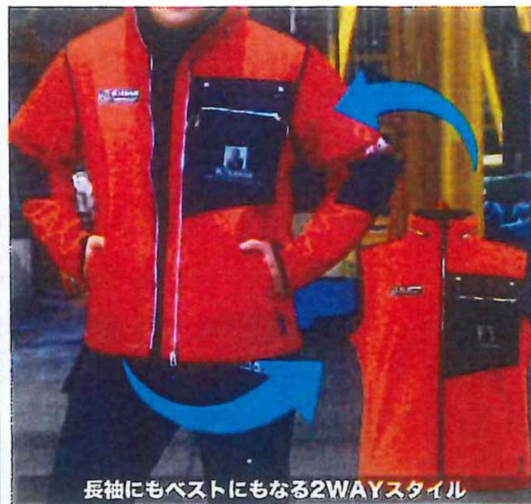
長袖にもベストにもなる2WAYスタイル