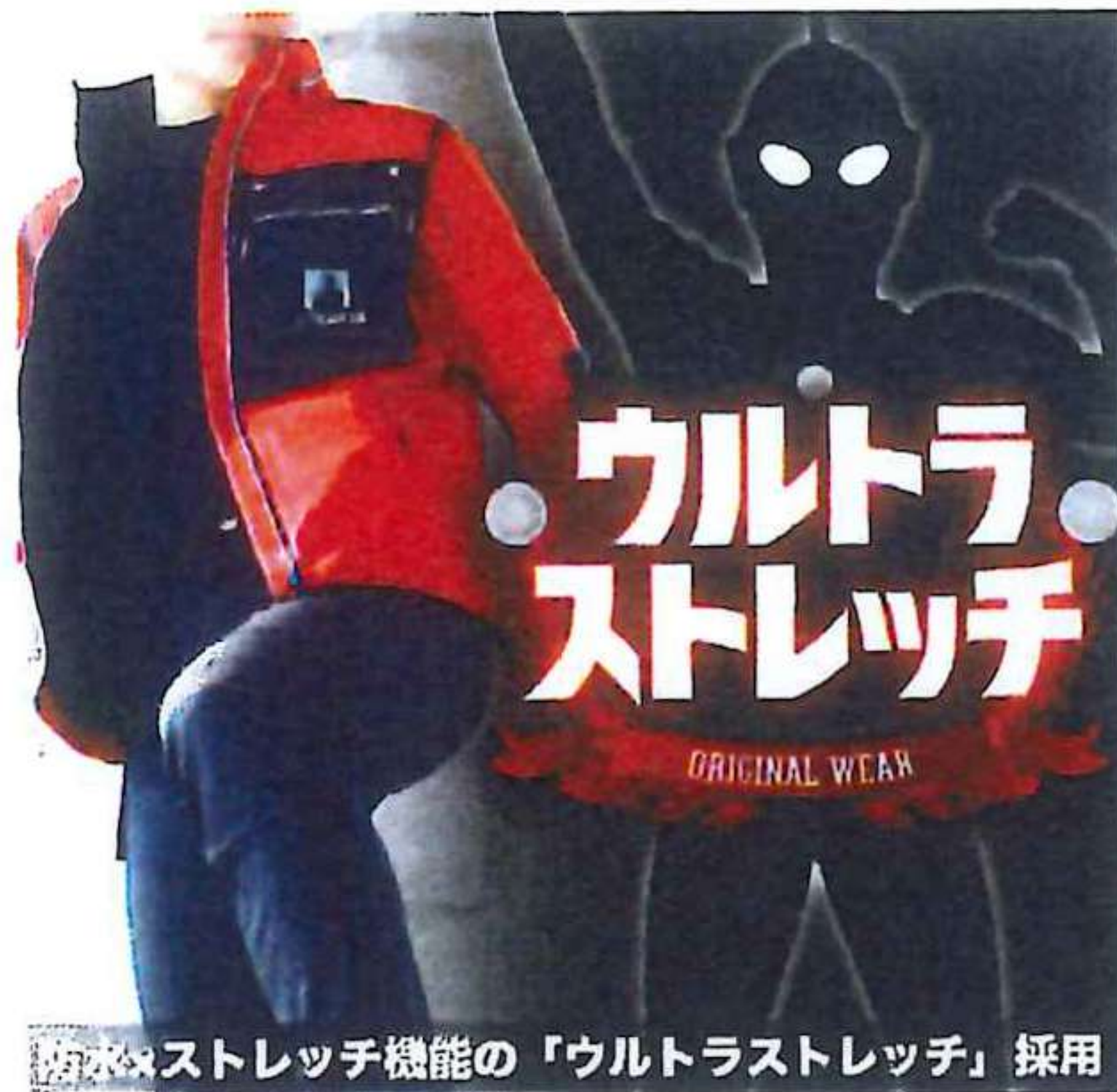
防水×ストレッチ機能の「ウルトラストレッチ」採用