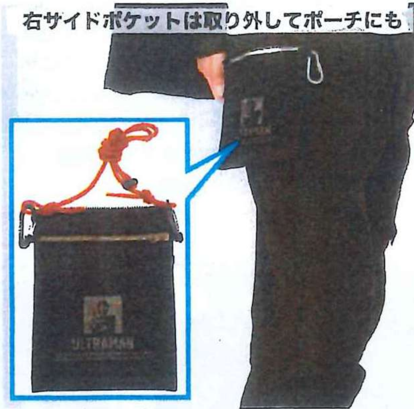
右サイドポケットは取り外してポーチにも