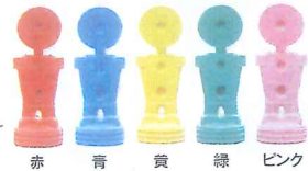
赤 青 黄 緑 ピンク

02 目的に合わせて140cm・100cm・40cmの 3サイズ から選べます。