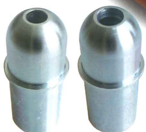
M8用 M10用 アダプター (別売)