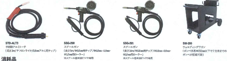
STD-TIGDIN TIGトーチ STD-ALT3 半自動アルミトーチ (長さ3m/テフロンライナ/0.8mmアルミ用チップ) SSG-200 スプールガン (長さ5m/φ0.8mm用チップ/φ0.8mm-0.9mm・φ1.0mm用ローラー) ※スプール径φ100ワイヤ専用 SSG-201 スプールガン (長さ10m/φ0.8mm用チップ/φ0.8mm-0.9mm・φ1.0mm用ローラー) ※スプール径φ100ワイヤ専用 SW-200 ウェルディングワゴン (ボンベ外形φ232mm以下で7立米までのボンベが搭載可能)