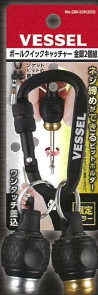
No.QB-22K2GS (ゴールド&シルバー)