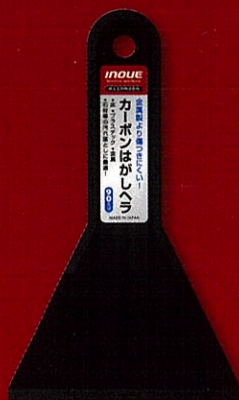
90mm 商品番号 17043 サイズ 90mm / 160mm JAN 4530545005261