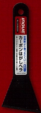
65mm 商品番号 17042 サイズ 65mm / 156mm JAN 4530545009511