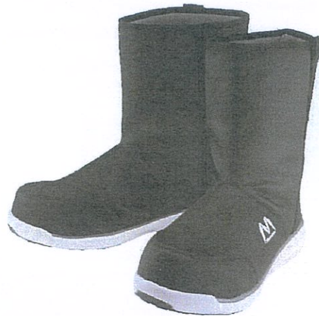
マンダムセーフティhigh#370