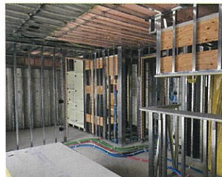
通電前の屋内作業に