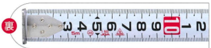
裏面「正縦数字」*メートル目盛のみ