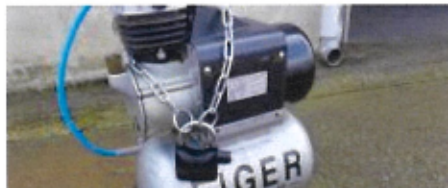
電動工具、建機の盗難防止など作業現場全全般の防犯対策に！