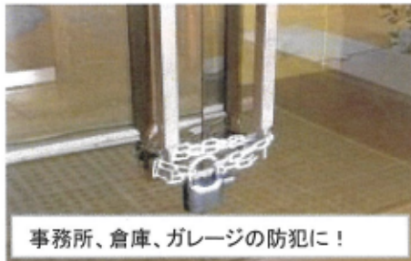
事務所、倉庫、ガレージの防犯に！

110dbの大音量アラームで警告！ アラームは約13秒後にストップし再度待機状態に戻ります。