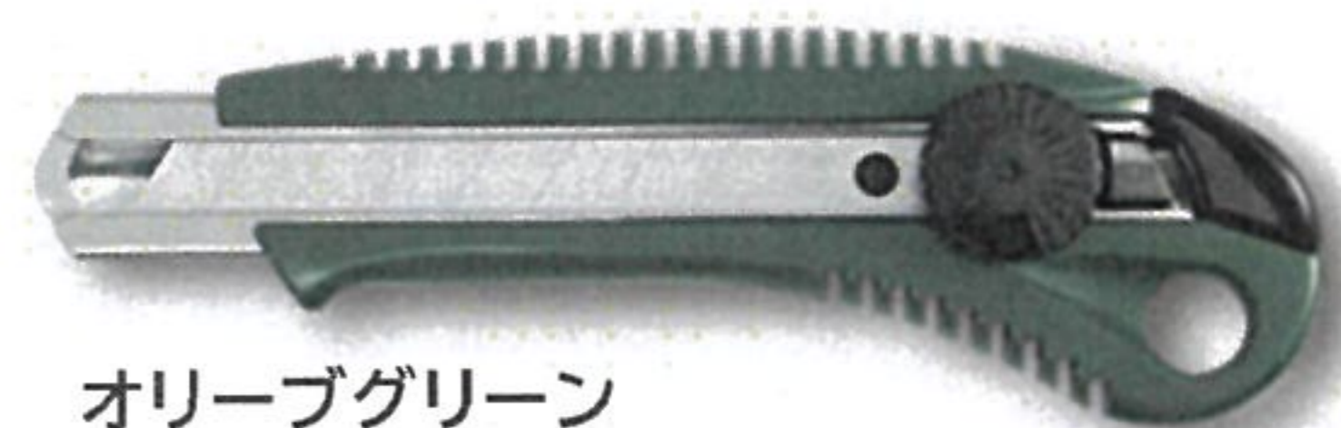
オリーブグリーン