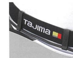
ヘッドバンドに固定できる ケーブルクリップ付