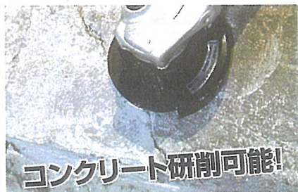
コンクリート研削可能!