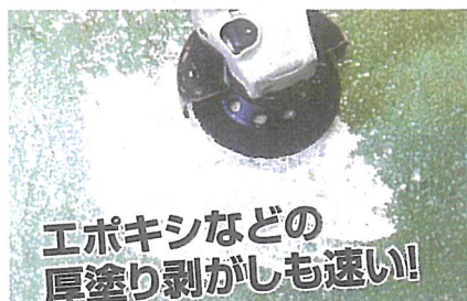
エポキシなどの 厚塗り剥がしも速い!