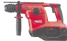
ハンマードリル TE 30-22