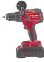
ドリルドライバー SF 6H-22