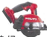
金属用丸ノコ SC 4MR-22