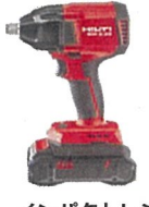
インパクトレンチ SIW 8-22