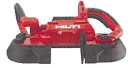
バンドソー SB 6-22