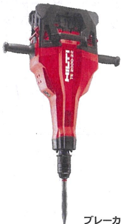
ブレーカー TE 2000-22