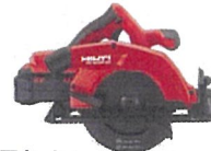
木工用丸ノコ SC 30WR-22