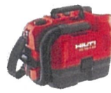
バキュームクリーナー VC 5-22