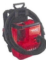
バキュームクリーナー VC 10L-22