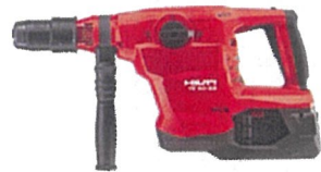
ハンマードリル TE 60-22