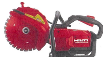
カットオフソー DSH 600-22