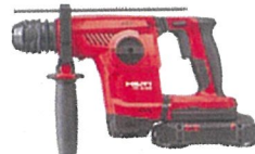
ハンマードリル TE 6-22