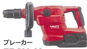
ブレーカー TE 500-22