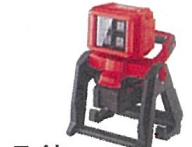
ライト SL 6-22