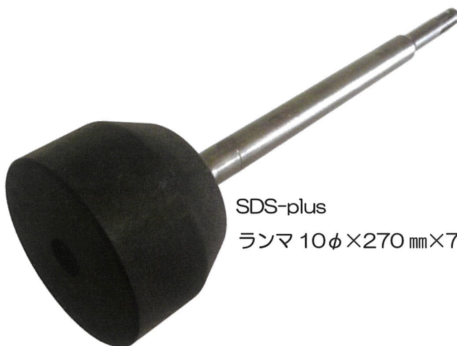
SDS-plus ランマ 10φ×270mm×70φ