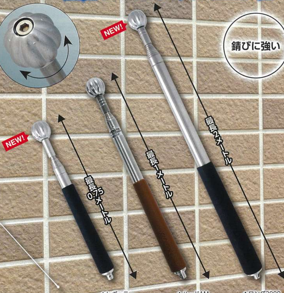
ステンでカボチャ玉打診棒