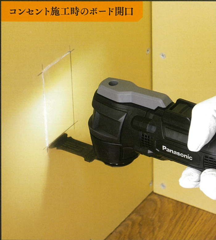
コンセント施工時のボード開口