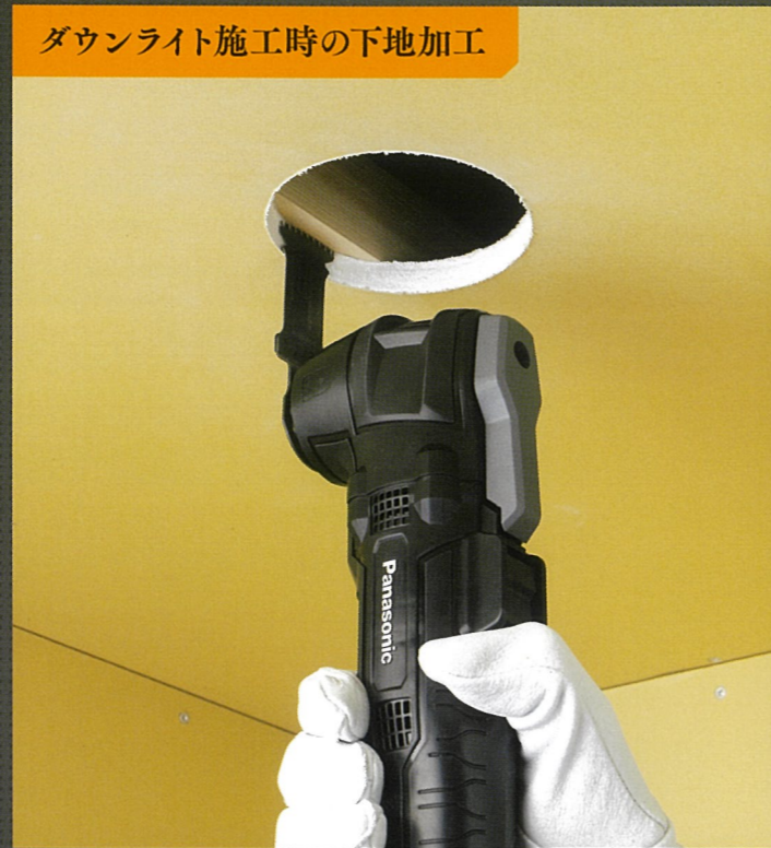
ダウンライト施工時の下地加工