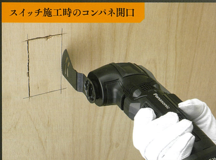
スイッチ施工時のコンパネ開口