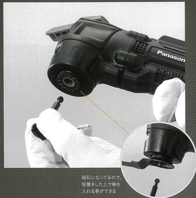
磁石になっているので、 仮置きした上で軸を 入れる事ができる