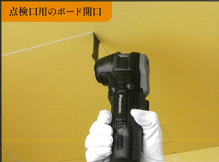
点検口用のボード開口