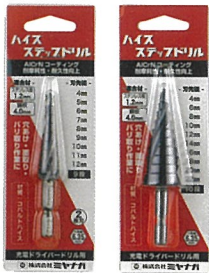
パッケージ (H148mm W50mm)