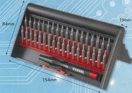
スタンド式ケース