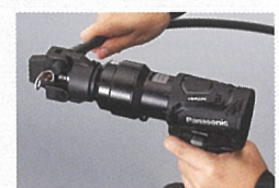
圧着アタッチメント EZ9HX502