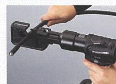
ケーブルカッターアタッチメント EZ9HX503