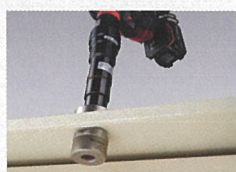
ロックアウトパンチアタッチメント EZ9HX505