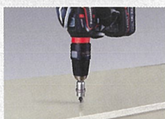
キイレスタックアタッチメント EZ9HX504