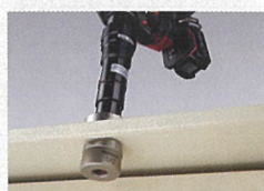
ロックアウトパンチアタッチメント EZ9HX505