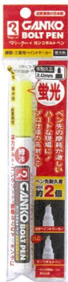
MKOBP-T44 蛍光イエロー 562950