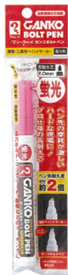
MKOBP-T42 蛍光ピンク 562943