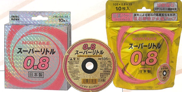
スーパーリトル外径 105mm 4 品番性能分布イメージ図

ステンレス / 一般鋼材の薄板 / 小径パイプの切断にオススメです。 スムーズな切れ味で切断面の焼け・バリの発生が低減します。 既存の 105mm ラインナップ同様、 内装仕様は通常箱と防湿パックの 2 種類がございます。