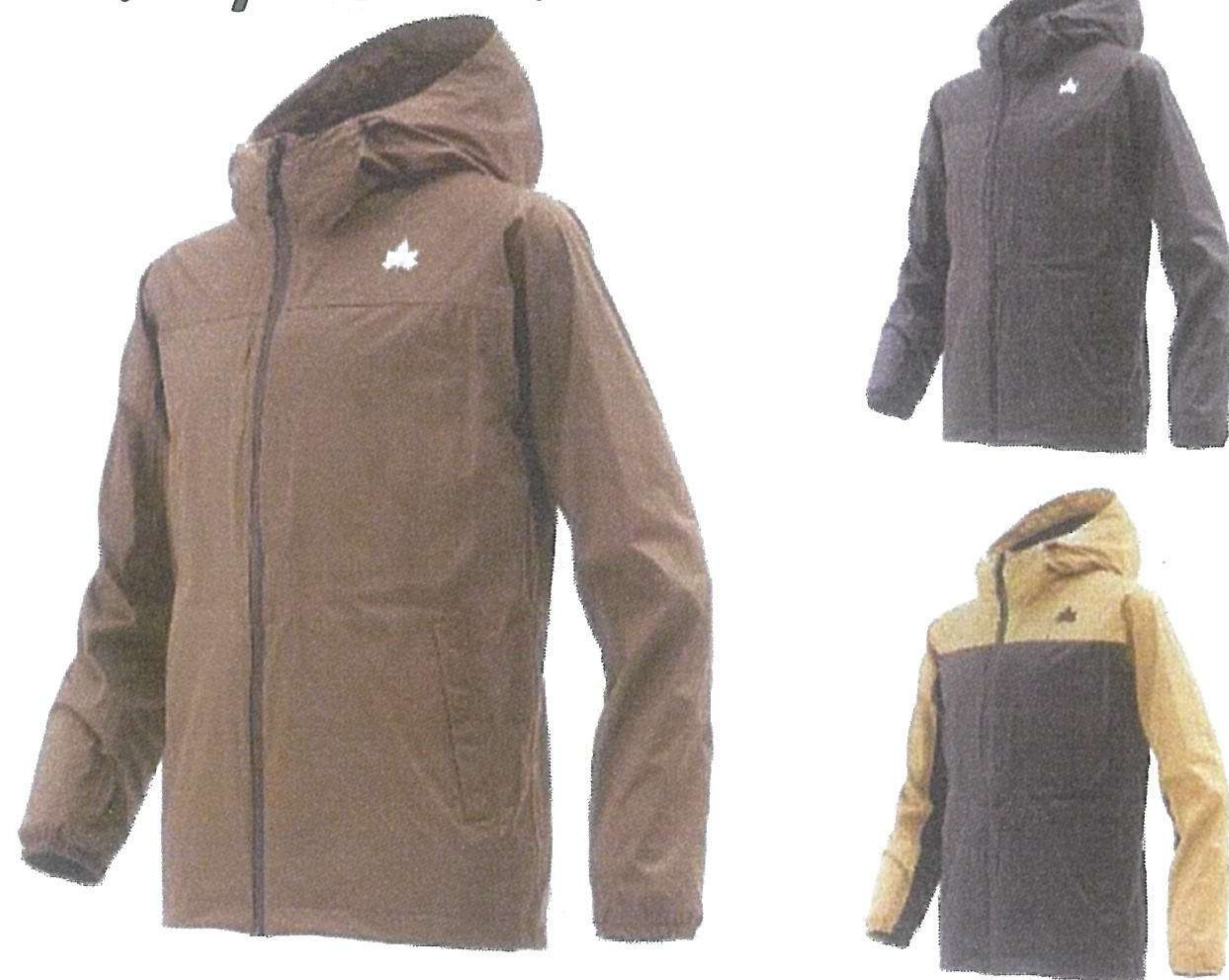
4WAYストレッチジャケット ラムダ