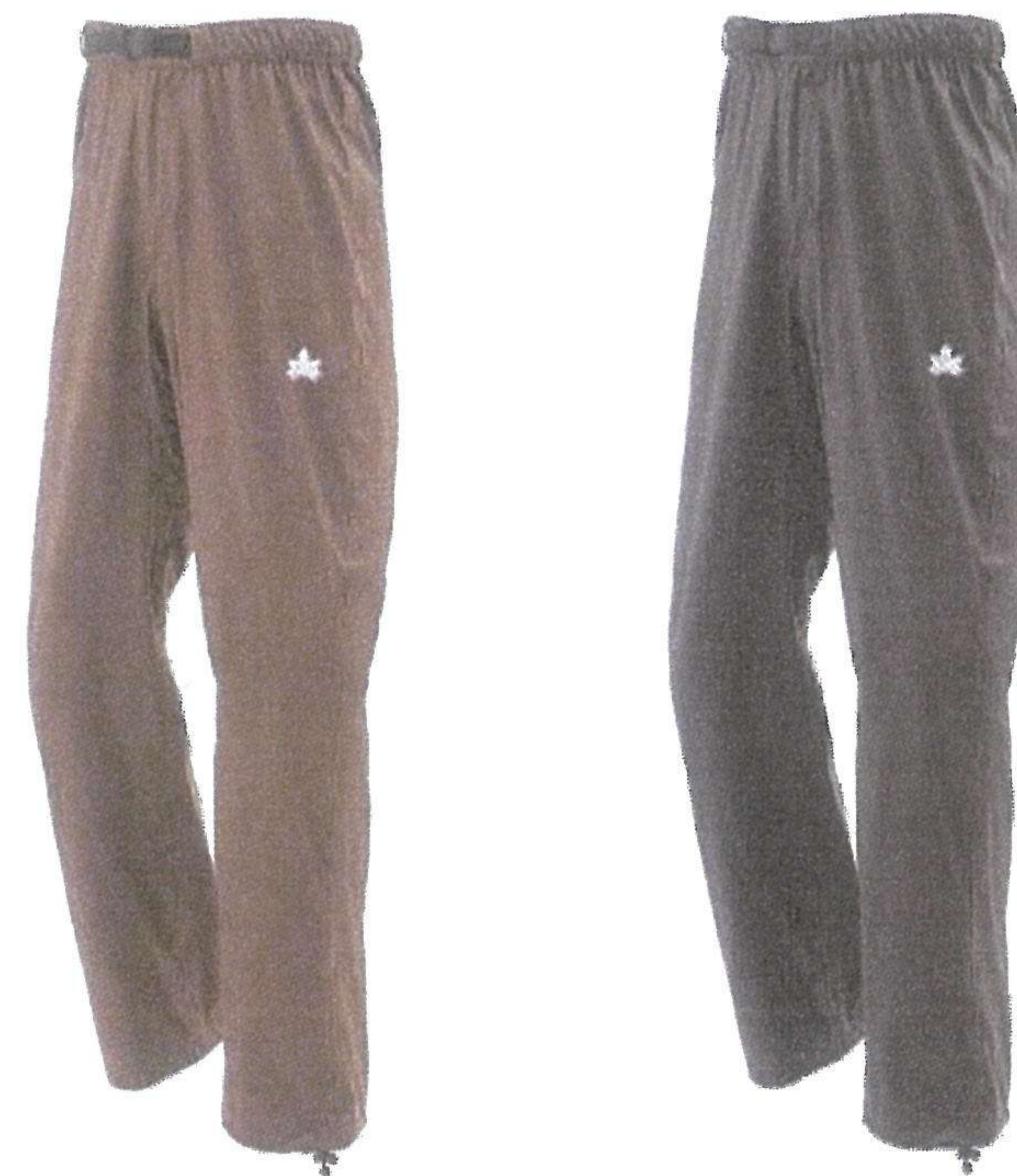
4WAYストレッチパンツ イータ