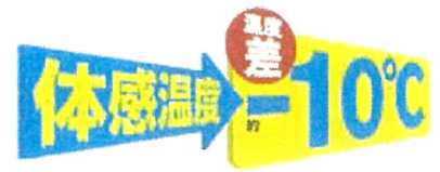
■遮熱ヘルメットの性能 (ヘルメット内部温度比較)