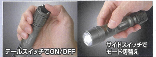
テールスイッチでON/OFF